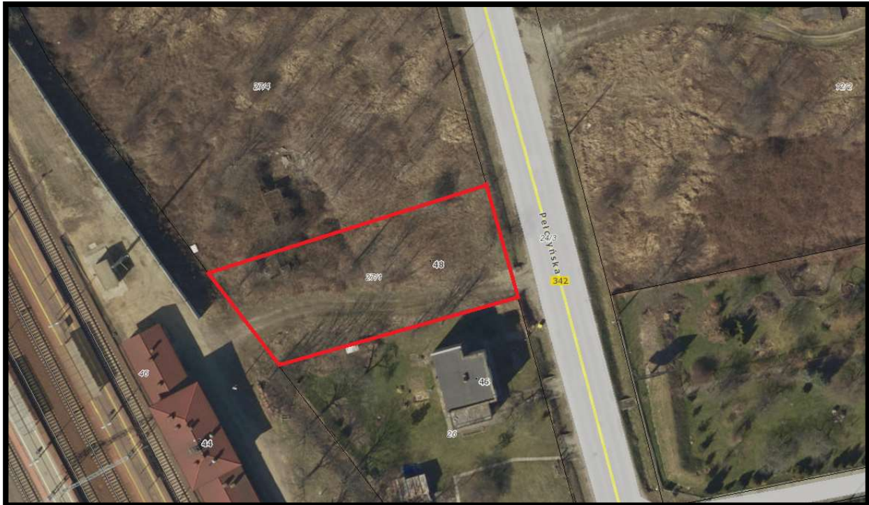
Plan orientacyjny dz. nr 27/1 AM 10 obręb Lipa Piotrowska;