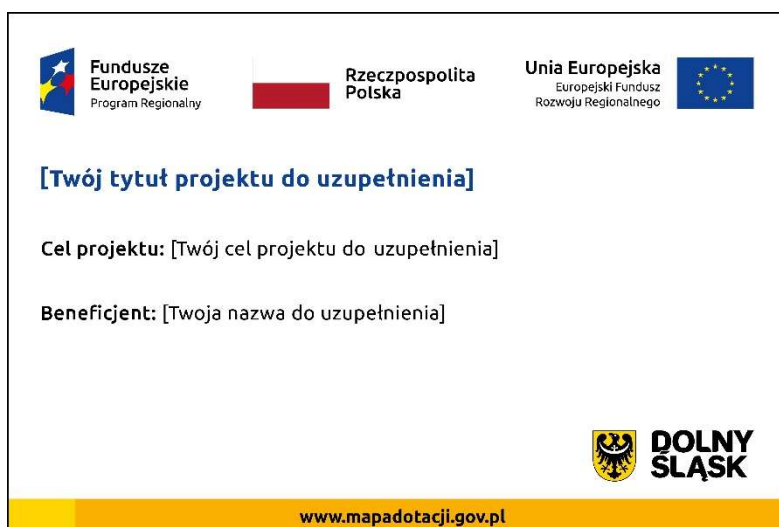
Wzór tablicy informacyjnej/pamiątkowej

Wymiar tablicy to 80 cm na 120 cm a jej wzór został zamieszczony poniżej.